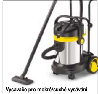
Vysavače pro mokré/suché vysávání